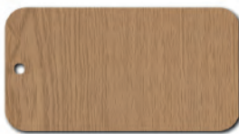
D9103 PR Jasny Dąb