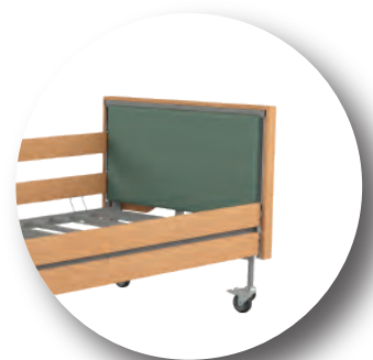
Szczyt tapicerowany kolor: VIENNA 14