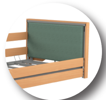
Szczyt tapicerowany kolor: VIENNA 14

• Taurus 2 LOW LUX dostępny z leżem metalowym lub drewnianym