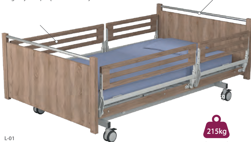
L-01 Drewniany szczyt z chromowaną rurką

Szczyty wykonane z płyty laminowanej oraz litego drewna bukowego