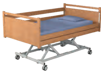
L-02 Drewniany szczyt z drewnianą listwą