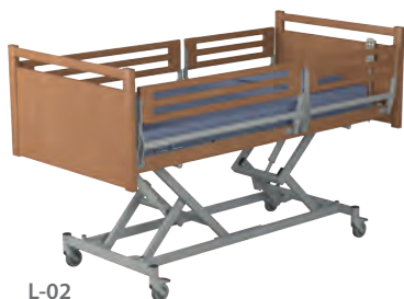
L-02 Drewniany szczyt z drewnianą listwą