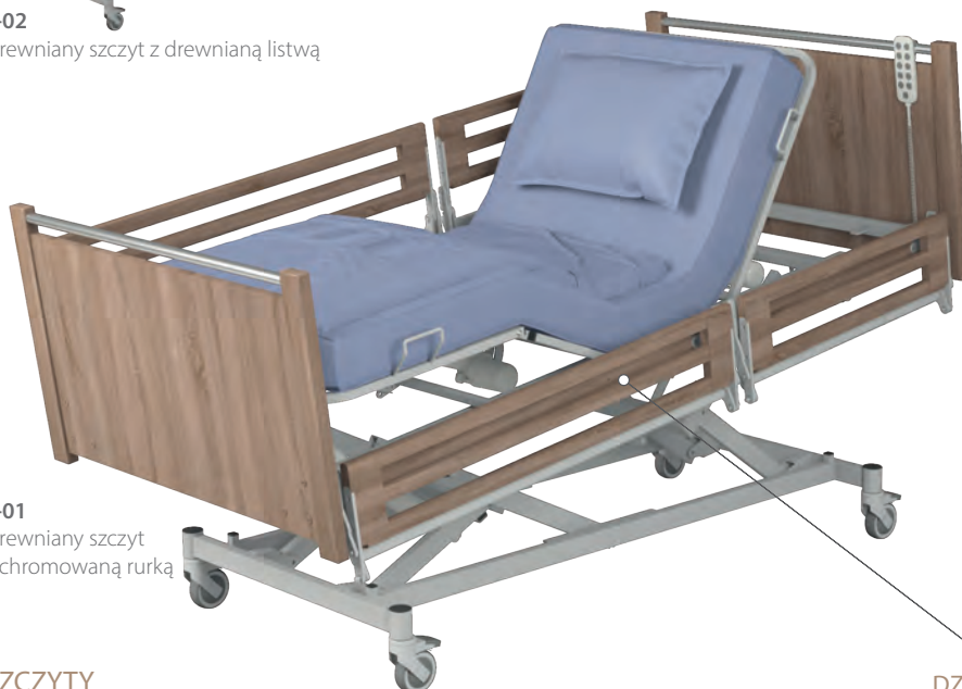
L-01 Drewniany szczyt z chromowaną rurką

Projektując model łóżka Leo, szczególną uwagę zwróciliśmy na zakres regulacji wysokości leża. Dla łóżka Leo wynosi on blisko 50cm. Najniższa wysokość - 30cm (zmienia się w zależności od średnicy zastosowanych kółek) pozwala pacjentowi na komfortowe wstawanie z łóżka oraz zmniejsza ryzyko upadku. Pozycja najwyższa znacznie ułatwia pielęgnację osoby leżącej przez personel medyczny.